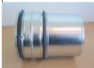
Bilde . 2