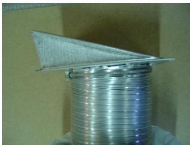
Bilde . 4